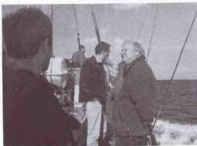
Er det en Måge???

Vejret var som tidligere nævnt ikke med os, da både vind og strøm gjorde at vi blev nødt til at fiske hvor vi kunne finde læ og ikke nødvendigvis hvor der var godt med flad fisk. Jeg fik ikke talt hvor mange flad fisk der blev fanget, men jeg vil tro at der blev fanget et sted mellem 80 og 100 flad fisk. Det syntes jeg ikke var så dårligt når man tog vret i betragtning.