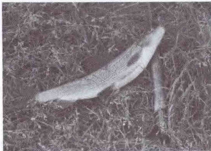
Stalling på 41 cm.

Sidst på eftermiddagen fiskede vi et stykke opstrøms Frihedsbroen, der var vi så heldige at opleve at se en hel masse Majfluer sværme. Fiskene gik helt amok i en timestid. Når en Majflue landede på vandet og drev med strømmen, gik der ikke lang tid før den blev taget af en ørred. Jeg havde heldigvis min flydeline og mine tørfluer i vesten, så jeg skiftede straks til tørflue. Det er en fantastisk oplevelse at stå og se sin flue blive taget af en hvid ørredmund.