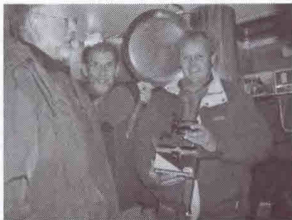
DEN STOLTE VINDER FRA FLADFISKETUREN