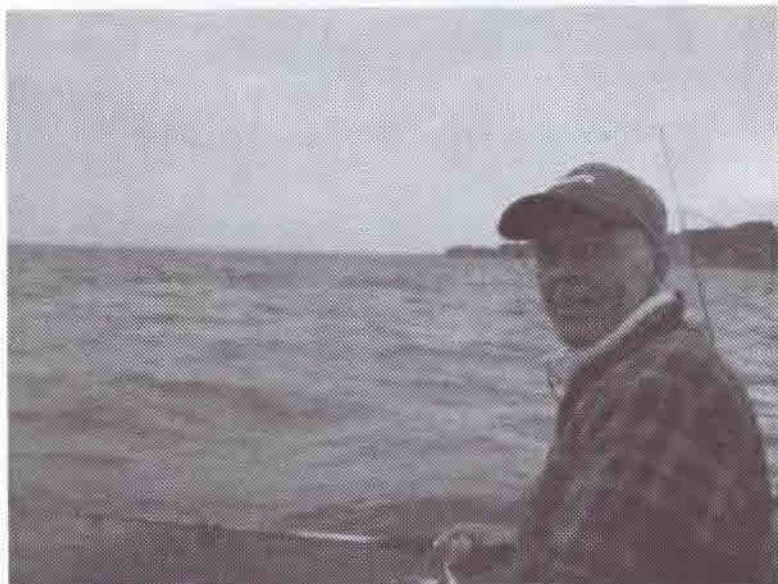
Bolværksmatros i knibe.

Onsdag d. 15.05.02 løb vores årlige fladfisketur af stablen. Det skal siges med det samme at vejret ikke var med os i år, så det kunne ses på fangst resultatet. Vi havde fyldt hele båden, som på nær 5 gæster, alle var medlemmer af Neptun. Så det med at Neptun's medlemmer ikke er til at drive ud og fiske blev gjort til skamme.