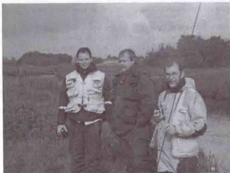
Tre af os

Fredag d. 24 maj var vi 4 gutter der tog til kongeåen for at prøve at fange lidt Stalling og Bækørreder. Vi havde bestilt en ferielejlighed hos Foldingbro Lystfisker Camping. Det var meget centralt for os da vi ville fiske på det stykke af Kongeåen som Vejen og Omegns Lystfiskerforening solgte dagkort til. Dagkort stykket strækker sig fra Foldingbro og op til Knagmølle. Vi fiskede mest fra Frihedsbroen og nedstrøms.